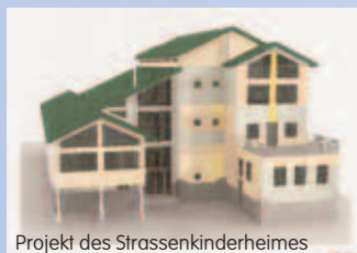
Projekt des Strassenkinderheimes