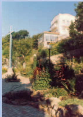
Blick von der Dachterrasse auf den weltbekanntesten botanischen Garten am Schwarzen Meer

und erholungsbedürftigen Familien in Jalta am Schwarzen Meer vom ukrain. orth. Patriarchen Filaret eingeweiht.