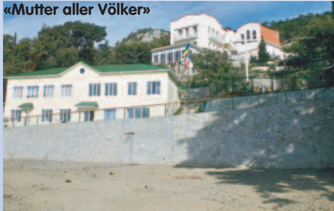
Südansicht des Zentrums mit dem zukünftigen Sportplatz der Kinder

Am 26. April wurde das Rehabilitations-Zentrum zur körperlichen und seelischen Genesung von 30 Strassenkindern, Tbc-kranken Kindern