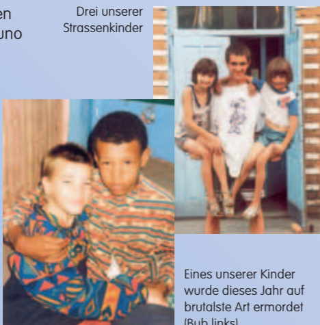
Eines unserer Kinder wurde dieses Jahr auf brutalste Art ermordet (Bub links)