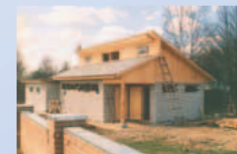
Neubau der Werkstätte im Rehabilitations-Zentrum für Drogensüchtige (Comunitä Cenacolo) ↓