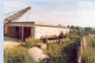
Neubau der Lager und Büros von «Triumph des Herzens» in Peresslawl-Salesskij

Restaurierung der vom Einsturz bedrohten orth. Kirche von Jerapolze für die Dorfbevölkerung und unsere Jugendlager in Russland