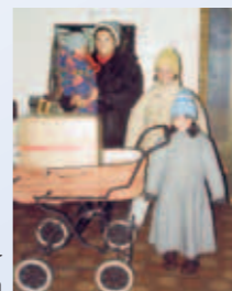
Alleinstehende Mutter von 4 Kindern

Planung und Bau des Heimes für schwangere Mütter, um ihnen Hoffnung und Geborgenheit zu schenken, damit sie sich für das werdende Leben entscheiden können.