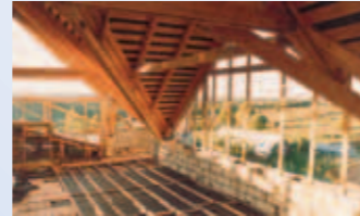
Blick in die Weiten Russlands