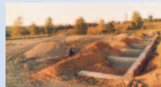
Bau von Spielplätzen

Am 28. Dez. 1942 werden von den Deutschen SS-Soldaten mehr als 300 Frauen und Kinder in der hölzernen Dorfkirche eingeschlossen. Die Kirche wird in Brand gesteckt. Alle sterben eines qualvollen Todes. Bis heute blieb Piski ohne Kirche. In Zusammenarbeit mit dem Deutschen Verein «Kirchen für den Osten» durften wir die Dreifaltigkeitskirche wieder aufbauen.