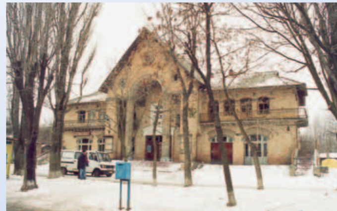
Das ehemalige Dorfkinos aus der Sowjet-Zeit am Stadtrand von Kiew