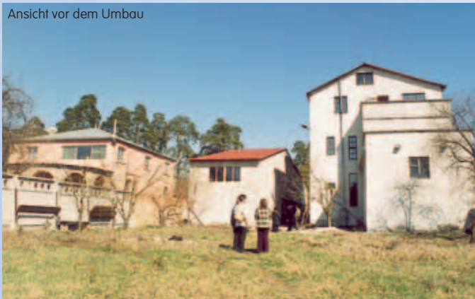
Ansicht vor dem Umbau