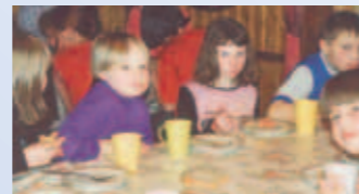
Jugendlager von Waisenkindern