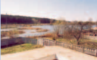
Aussicht von der Terrasse auf den See