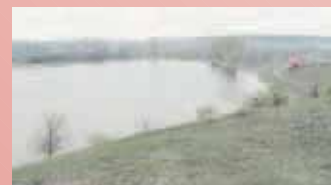
12 Hektar See