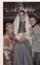
Krippenspiel unserer Kinder