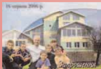
Einladung zur Einweihung