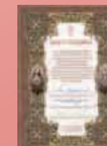
Dankesbrief der kath. Bischöfe

Mehr als 500 Jugendliche wurden in unseren Ferienhäusern betreut.