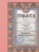
Ein weiterer Orden vom Mosk. Patriarchat für «Triumph des Herzens». Orden des Hl. Agapit