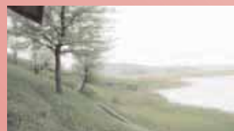
12 Hektar Land