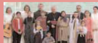
Einige unserer Kinder mit Schwestern der «PDF-Familie Mariens»