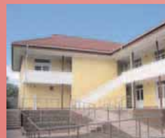
Wohnung für Mütter und Frauen in Not