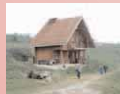
Das 1. Ferienhaus in Fastow