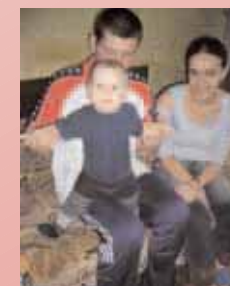
Junge Familie unserer Kinder