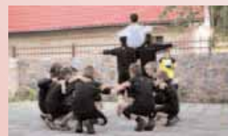
Präsentation unserer Kinder

Unser neues Projekt in Fastow: Freizeit-Zentrum, Bauernhof und Fischzucht zum Unterhalt unseres Rehabilitations-Zentrums in Kiew und als Arbeitstherapie für unsere Kinder.