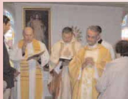
Einsegnung durch den Generalvikar