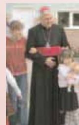
Der röm. kath. Ortsbischof