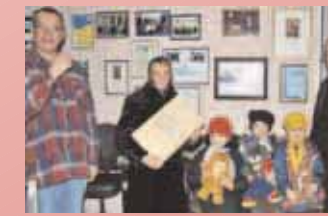
3 LKW mit Geschenkspaketen aus Luxemburg