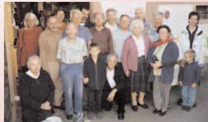
Mitarbeiter nach dem Beladen des 1000. LKW für Ost-Europa in der Schweiz