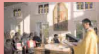
1. Heilige Messe