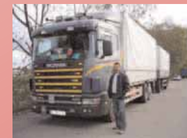
Der 1000. LKW für Ost-Europa

In der Ukraine wurden die Hilfsgüter landesweit an mehr als 800 soziale Einrichtungen verteilt; darunter sind 400 verschiedene Pfarreien und kirchliche Organisationen. In Russland ging die Hilfe vor allem ins Gebiet von Jaroslawl, Smolensk, Kursk und Wladimir. Hier wurden Kinderheime und Internate berücksichtigt, sowie soziale Institutionen, mehrere Pfarreien, Gefängnisse und Spitäler. In Litauen halfen wir kath. Pfarreien, in Rumänien 4 Caritas und Pfarreien verschiedener Konfessionen. Unsere 6 LKW sind ganzjährig mit einheimischen Fahrern besetzt.