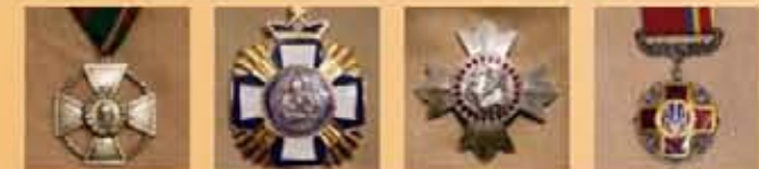
Weitere 4 Verdienst-Orden für «Triumph des Herzens» vom Moskauer Patriarchat, Kiewer Patriarchat, Präsident V. A. Juschtschenko und vom Ungarischen Präsidenten