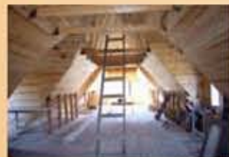
Neues Atelier für Heimarbeit