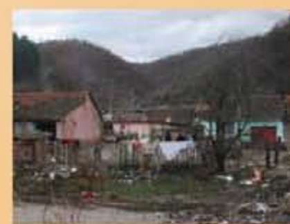
Häuser der Armen ohne Wasser, Kanalisation, WC und z.T. Elektrizität