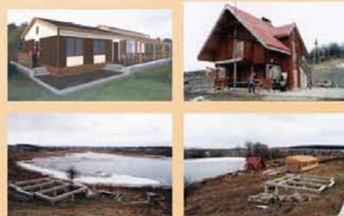
12 Hektar See – 12 Hektar Land

Unser Projekt in Fastow: Freizeit-Zentrum, Bauernhof und Fischzucht zum Unterhalt unseres Rehabilitations-Zentrums in Kiew und als Arbeitstherapie für unsere Kinder. Wir suchen Paten für dieses Projekt.