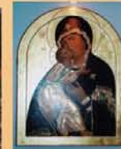
Die Ikone der «Mutter der Barmherzigkeit» in der Hauskapelle

Beth Myriam: 47 Strassenkinder und Kinder aus armen Familien werden betreut.