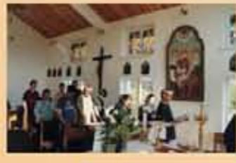
«Glorreiches Kreuz» im Geburtsort von Präsident V. A. Juschtschenko