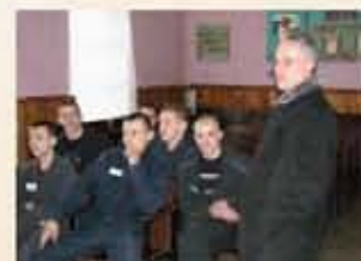
Im Jugendgefängnis von Kursk

Fierliche Übergabe von 1 Reliquie des hl. Nikolaus von Bari an die orth. Pfarrei von Cholm Schirkowskij (Smolensk).