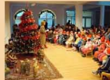
Weihnachtsfeier im Zentrum